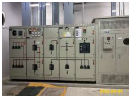
ภาพที่ 1.2-2 สภาพโครงการปัจจุบัน